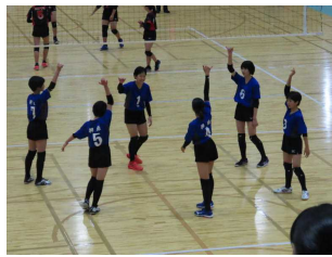
↑準優勝の女子バレー部