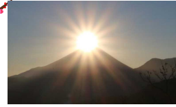
富士川町高下のダイヤモンド富士