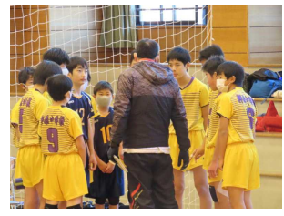
↑3位の男子バレー部

さきほどの「何も咲かない寒い日は下へ下へと根を伸ばせ」に続く言葉は「 やがて大きな花が咲く 」です。春になって、大きな花を咲かせましょう！今後の押中生に期待してください！